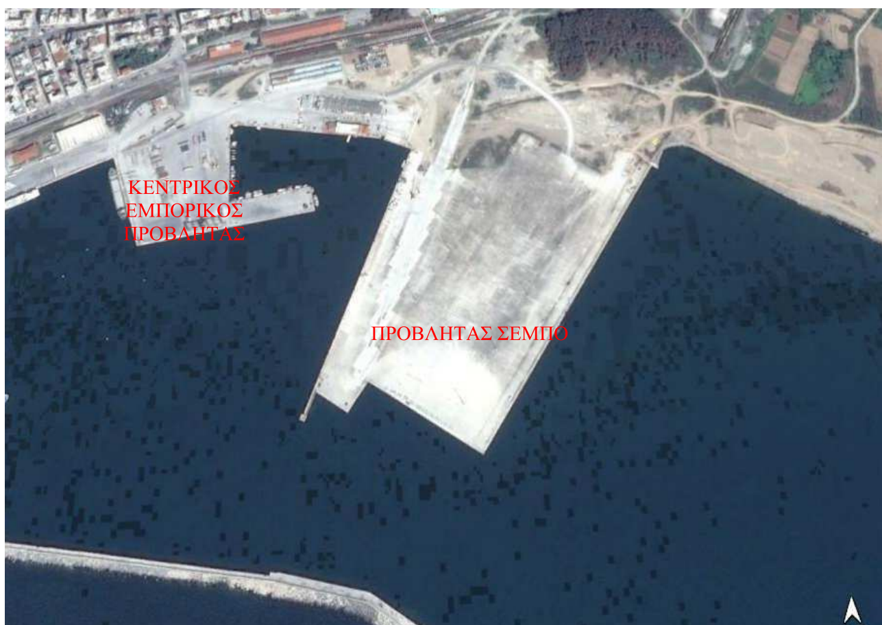
Εικόνα 1: Επισήμανση περιοχής εργασιών εντός του εμπορικού λιμένα Αλεξανδρούπολης.