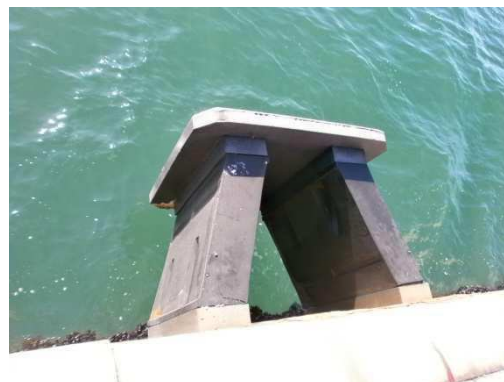
Εικόνες 12-13: Τυπικές εικόνες προσκρουστήρων προβλήτα ΣΕΜΠΟ χωρίς φθορές υλικού (προς συντήρηση)