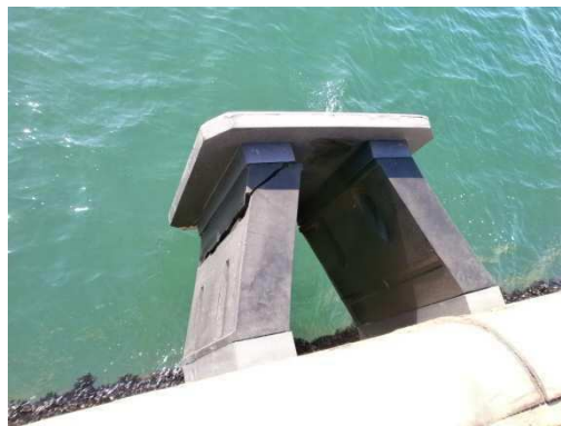
Εικόνες 6-9: Τυπικές εικόνες φθορών προσκρουστήρων προβλήτα ΣΕΜΠΟ (προς αντικατάσταση – επισκευή)