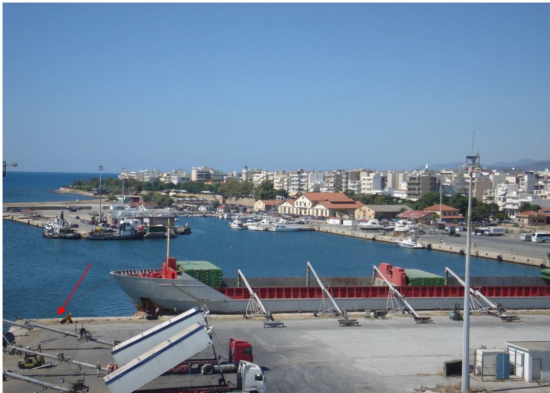
Εικόνα 14: Δυτικό κρηπίδωμα κεντρικού εμπορικού προβλήτα δυτικού τομέα λιμένα. Επισημαίνεται η θέση της προς αντικατάσταση σπασμένης δέστρας