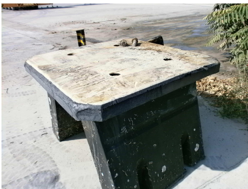
Εικόνες 10-11: Τυπικές εικόνες καθαιρεθέντων προσκρουστήρων που ανελκύστηκαν (δυνατότητα επαναχρησιμοποίησης ελαστικών αποστατών και αντιτριβικών πλακών που έχουν διατηρηθεί σε καλή κατάσταση)